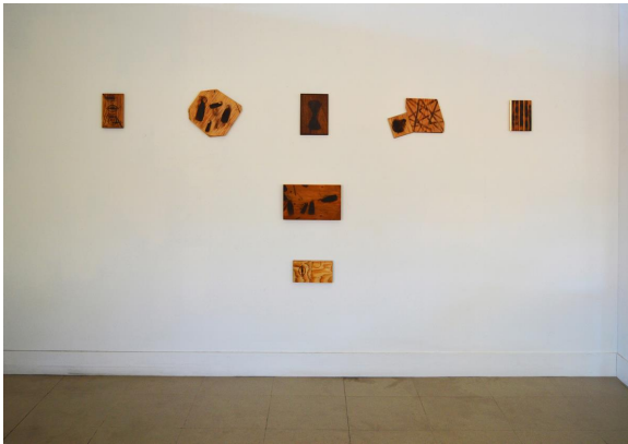
Página 3 El corazón de los muertos, 2012 - 2014 Hierro, latón, madera de pino, nogal y afropin (abedul) Quemadas y bañadas en aceite hirviendo 171 x 490 x 3,4 cm Única