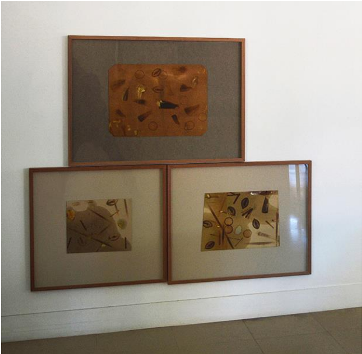
Fernando Sinaga. La vida dañada. Psicografías I, II y III (brandeas). 2015