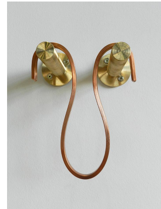
Página 4 Algo se acaba, 2013 Cobre y latón 23 x 18 x 14 cm. Única + P.A.